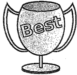
<第70回 立川市民体育大会 地区対抗種目得点表>