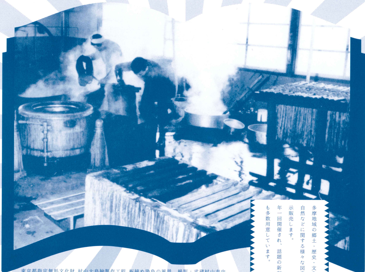
東京都指定無形文化財 村山大島紬製作工程 板締め染色の風景 撮影：武蔵村山市内

多摩地域の郷土・歴史・文化財・自然などに関する様々な図書を展示販売します。 年一回開催され、話題の新刊図書も多数用意しています。