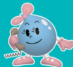
東京都水道局 マスコットキャラクター「水玉ちゃん」