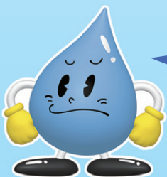
東京都水道局 マスコットキャラクター「水滴くん」