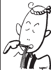
西砂川伝統 手打ちうどん