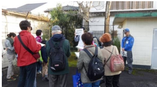
住宅街の中にもある 水源施設

街中に点在する大小様々な水道施設等を見て回り、水道水が提供される仕組みを紹介します。