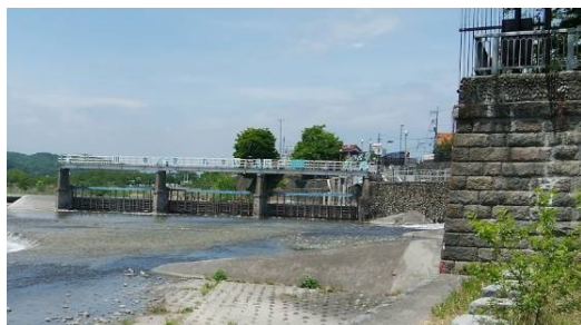
江戸時代の投渡しの技術を継承する 羽村取水堰