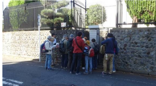
水道管の水圧を管理する 道路上の水道設備