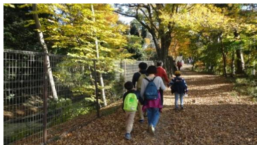
江戸時代給水を目的とし築造された 玉川上水

本ウォーキングツアーは、 全コースを水道局職員がガイドしながら案内 します。また、参加者の皆さまにクイズに挑戦いただく等、 楽しく分かりやすく水道事業を説明 いたします！