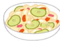
ツナマカロニサラダ