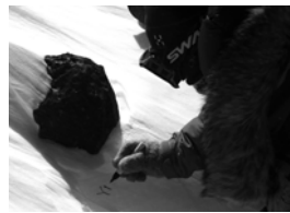
南極での隕石探査

1969年、日本の観測隊として初めて第10次隊 が南極で隕石を採取しました。 南極隕石発見50周年を記念して、スペシャル トークイベントを開催します。