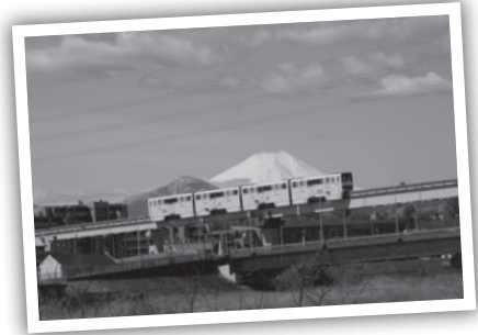
ダイヤモンド富士が見られる駅