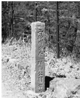
高さ一一〇cm 角柱 記載された文字

南面・昭和二年三月 拝島村青年団 東面・西砂川方面 ← 拝島公園方面 西面・→ 拝島中央二至ル 北面・→ 拝島駅方面 ← 砂川方面