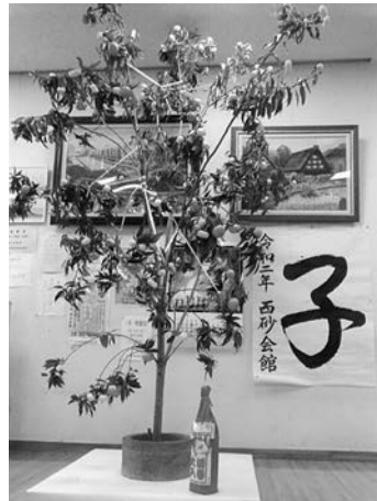
『まゆ玉飾り』 一月五日（日）に親子二十名以上参加、和やかに行われました。