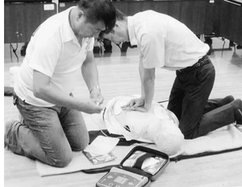
『防災訓練と利用者団体との懇談会』 九月八日（日）に防災訓練を行いました。