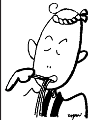
西砂川伝統 手打ちうどん