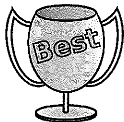
<第73回 立川市民体育大会 地区対抗種目得点表>