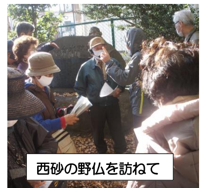
西砂の野仏を訪ねて