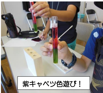
紫キャベツ色遊び！